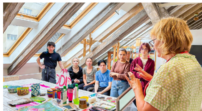
Kunststudierende aus Timisoara konnten an einem Workshop von Mundwilers langjähriger Erfahrung profitieren.